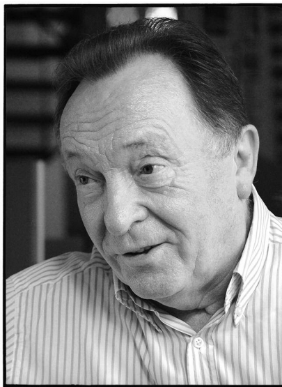
Peter Sodann 1989 (li.) und 2009 (re.)